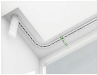
Ancho de cortina para carril en arco hasta 20 cm