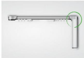
Motor de giro a la derecha