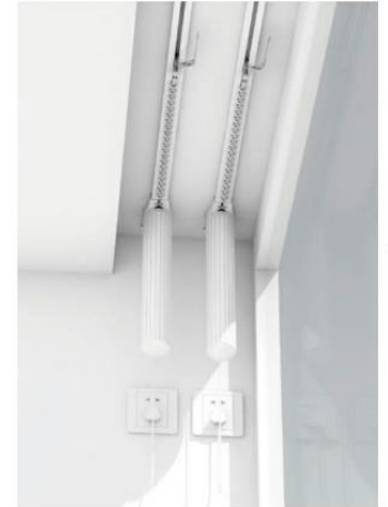
Fuente de poder de reserva