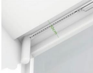
Ancho de cortina hasta 10 cm