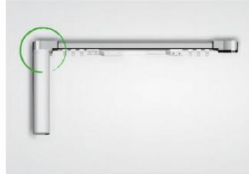
Motor de giro a la izquierda