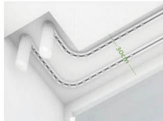
Ancho de cortinas en doble carril en arco hasta 30 cm