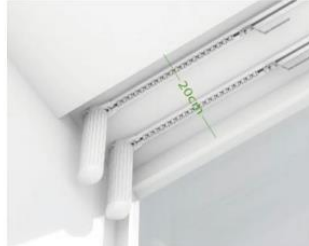
Ancho de cortinas para doble carril hasta 20 cm